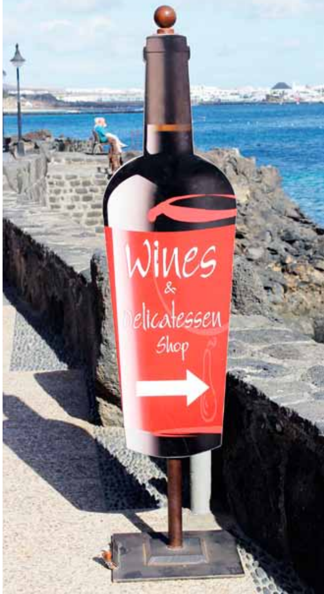
Strandpromenaden. Mil etter mil med strand og sjø innbyr til ulike aktiviteter som å sykle, drikke god vin eller bare nært samvær.