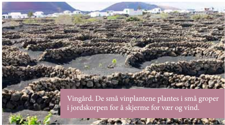
Vingård. De små vinplantene plantes i små groper i jordskorpen for å skjerme for vær og vind.