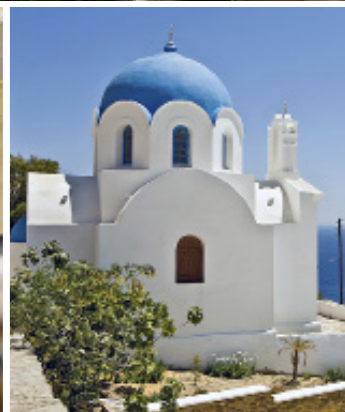
KYKLADENE. Halvveis mellom Naxos og Santorini ligger Ios. Fiskerne gjør klart bruket. Gudshusene er karakteristisk blå og hvit.