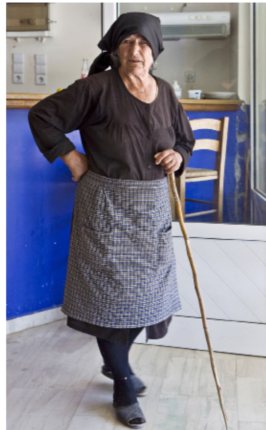
GAMMEL DAME. Gamle greske damer er liksom så mye eldre enn andre gamle damer.

Det er stillere på flyet, alle ungene og ungdommene er på skolen. Det er stillere på flyplassen, antallet charterflygninger er begrenset. Det er stillere i gatebildet, mange færre mennesker, mopeder og tutende taxier. Det er stillere på markedet, og tid til å lete og finne godbitene i salgsbodene. Og det er stillere på stranden, det er mulig å få seg en solseng i strandkanten uten å måtte stå opp når hanen galer.