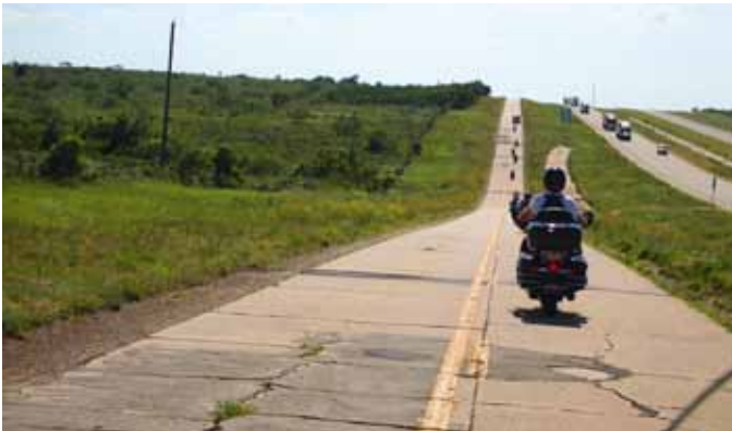
LANGT. Vi kjører på den «opprinnelige» Route66 med Interstate-motorveien ved siden av – og veistrekkninger så lang som øyet kan se.