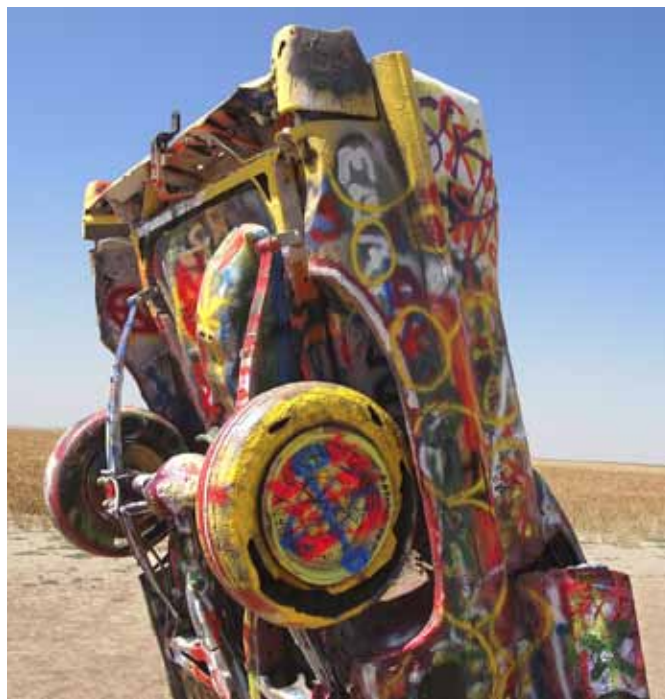
BILKUNST. Ti Cadillac'er med hodet i sanden! På veien mot Los Angeles stopper vi og nyter synet av kunstverkene – de gamle cadillacene som ser ut som om de er kommet fra himmelen og som folk kan spraylakkere og skrive sine navn på.

★ Endestoppet på vår reise er i Los Angeles. Her besøker vi Hollywood og Walk on fame, spaserer på Venice beach og får en sightseeing i Universal Studios. Los Angeles er Baywatch og muskler og filmindustri, og som vår guide i Universal Studio sa: Ingenting er som det ser ut i Hollywood.