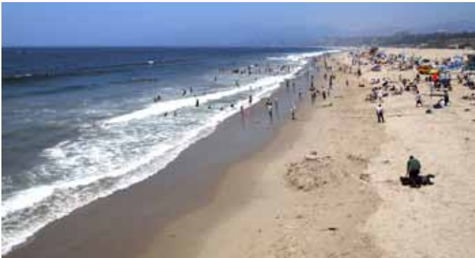
SANTA MONICA. Den kjente stranden i Los Angeles som du bare «må» oppleve. Her er blant annet filmen Baywatch spilt inn.