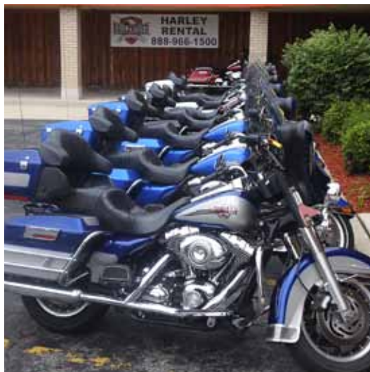
KROM. Harley Davidson-sykler på rekke og rad før start – et imponerende syn.