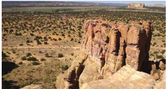
GRAND CANYON. Guds eget underverk er nasjonalparken Grand Canyon kalt. Et vakkert skue!