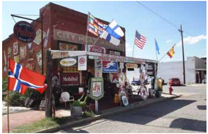
SUVENIRER. En typisk butikk langs ruten. Fylt opp av suvenirer, gamle skilt og krimkrans.