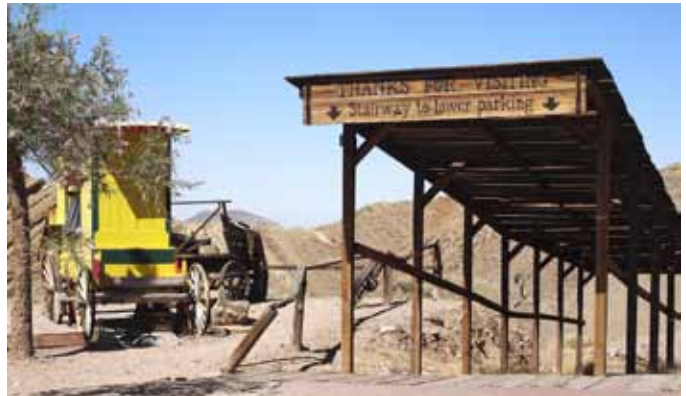
GRUVEBY. Ulike opplevelser og stopp underveis gir nødvendige avbrekk i kjøringen. Her fra en nedlagt gruveby i ørkenen.